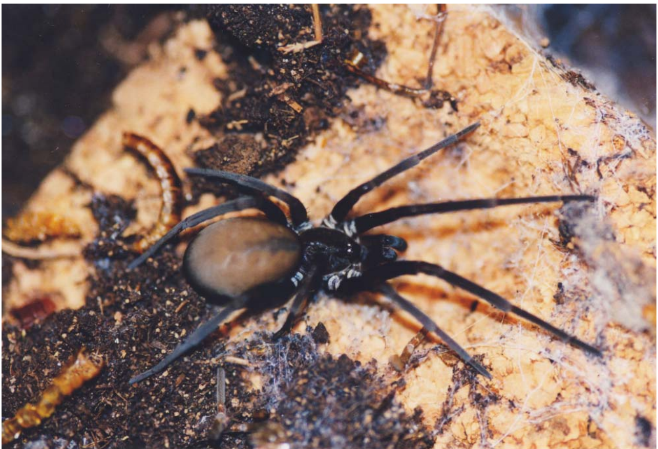
Filistata spec. aus Französisch-Guayana

Doch kommen wir zurück zu den von mir im Terrarium gehaltenen Exemplaren dieser Familie.